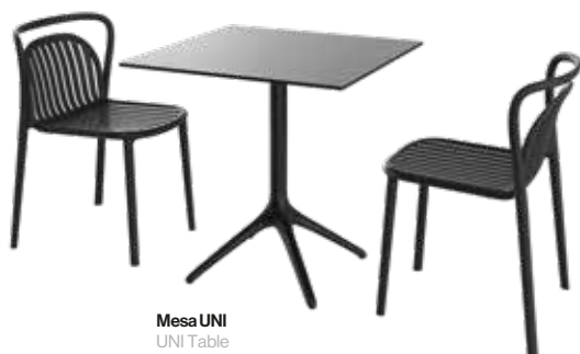
Mesa UNI UNI Table