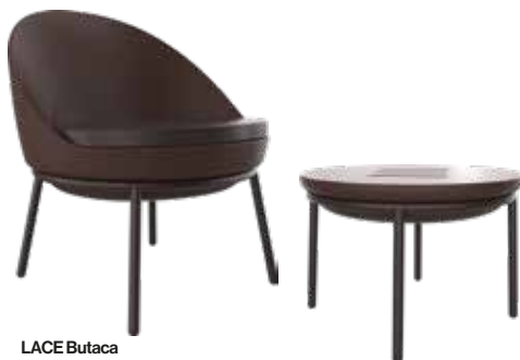
LACE Butaca LACE Armchair