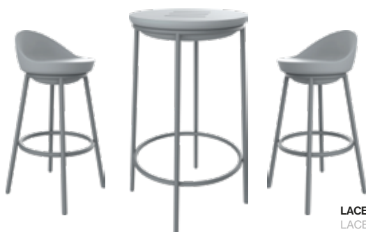
LACE Taburete LACE Stool