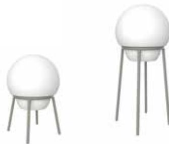
LACE Lampara High LACE Lamp High

LED RGB AUTONOMY: 8h CHARGE TIME: 6h BATTERY: Removable REMOTE CONTROL