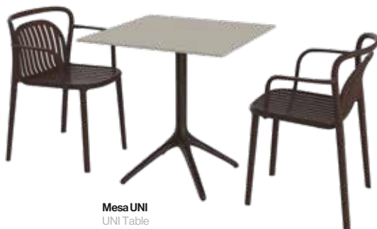
Mesa UNI UNI Table